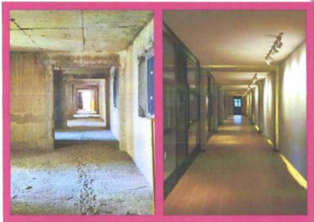
Antes e depois da obra do Espaço Conectar (5º andar).