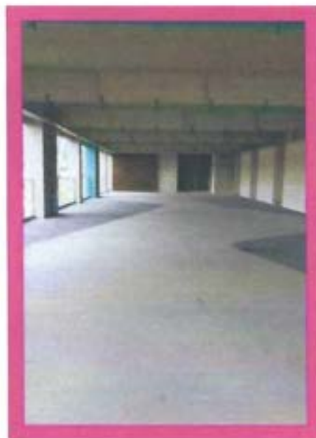
Espaço Conectar (prédio fachada de vidro) com previsão de finalização em 2024.